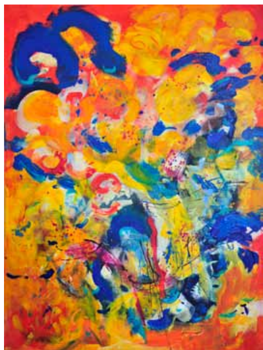
MIRA LIČEN KRMPOTIČ Ljubezen je ..., 2017 akril na platnu