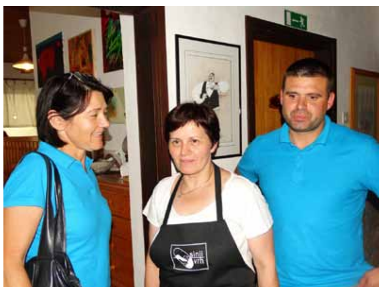
Trije stebri kolonije Umetniki za karitas