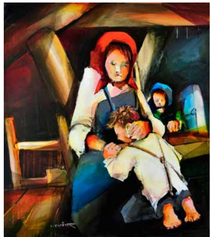
LEANDER FUŽIR Vrnitev izgubljenega sina, 2017 akril na platnu

Črna figura na belini podlage zaživi v vsej moči in prepričljivosti, kot nenehno variabilno znakovno znamenje. Zdi se, da je statičnost le hipno stanje in bo figura že naslednji trenutek nadaljevala s svojo novo figuro iz plesne koreografije. Lateralno obravnavanje prostora in lahkotnost ter gibkost figur, ki tako rekoč lebdi v tem neskončnem prizorišču, še poudarjajo slikarkino izrazno moč zastavljenega problemskega fokusa.