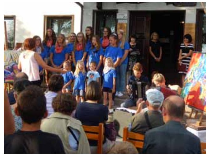
Mladi pevci iz Cola