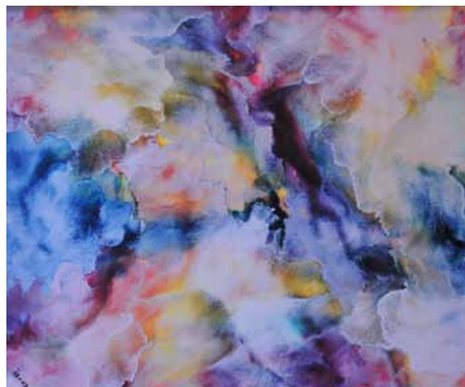
JANEZ ŠTROS Tudi ti si angel, 2017 olje na platnu