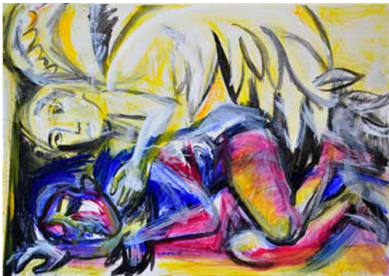
MARKO ANDLOVIC Angel varuh, 2017 akril na platnu

Akademski slikar in grafik Marko Andlovic je doma iz Vipave, njegov življenjski prostor pa je Ljubljana, kjer je zaposlen kot likovni pedagog. Na Sinji vrh je ponovno prišel po dvajsetih letih. Takrat je na koloniji Umetniki za karitas slikal zgodbo o izgubljenem sinu, tokrat je svojo ustvarjalno pozornost posvetil angelu varuhu.