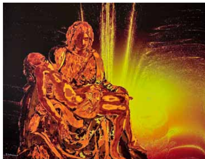
BOGDAN SOBAN Pieta, 2017 računalniška grafika