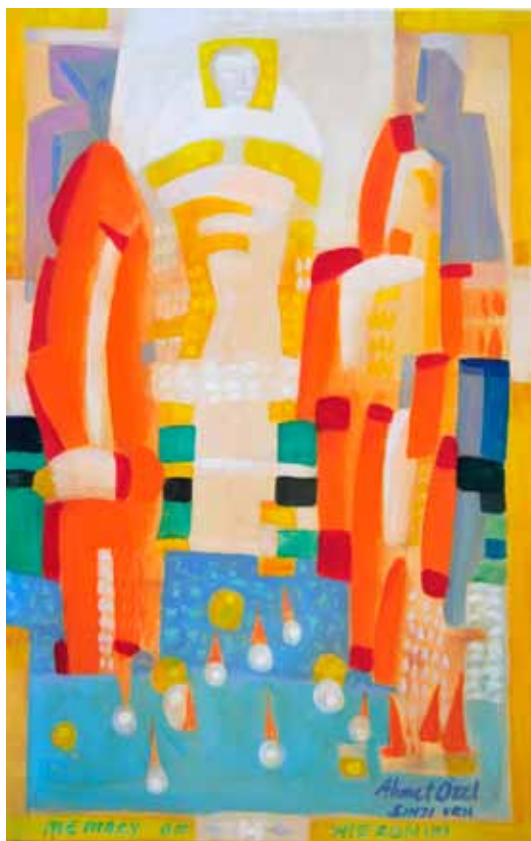
AHMET ÖZEL Feelings, 2017 akril na platnu