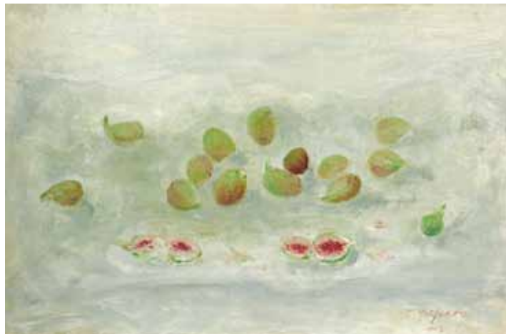
TONE SEIFERT Silvine fige, 2017 olje na platnu