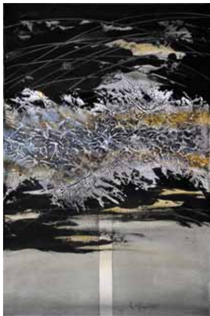
MILENA GREGORČIČ Valovanje, 2017 mešana tehnika na platnu