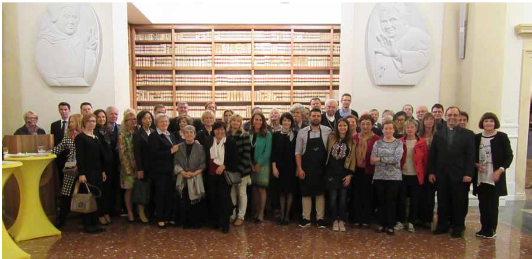
Rim, Umetniki za karitas: april 2017, udeleženci razstave v Rimu