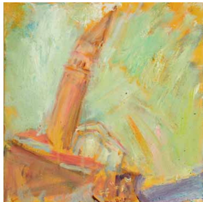
JOŠT SNOJ Piran v soncu, 2017 olje na platnu