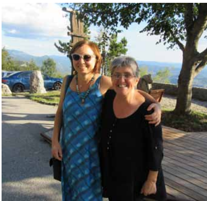
Silva in Mira