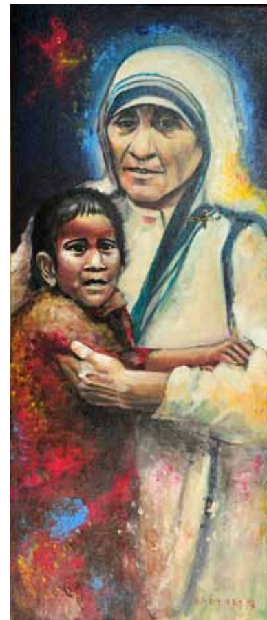
JOŽE BARTOLJ Mati Terezija, 2017 akril na platnu