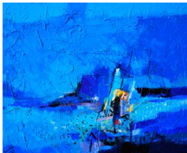
AZAD KARIM Dotik spominov, 2017 akril na platnu