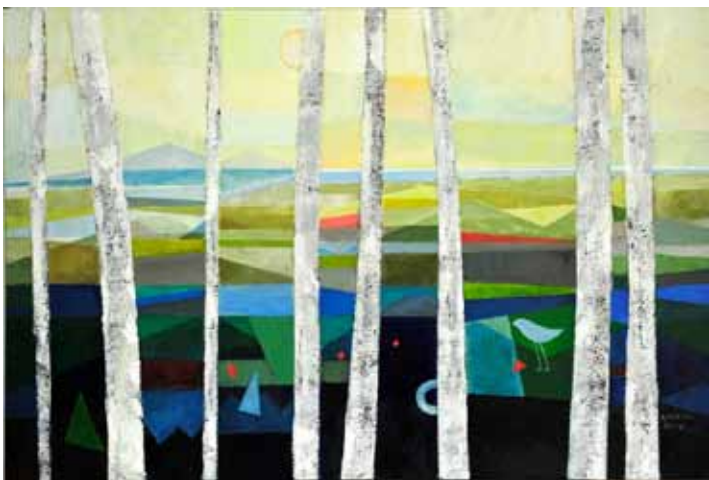
SILVA KARIM Krajina z modro ptico, 2017 akril na platnu