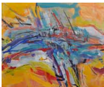
MIRA LIČEN KRMPOTIĆ